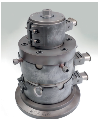
tool without insulation, before Werkzeug ohne Isolation, vorher