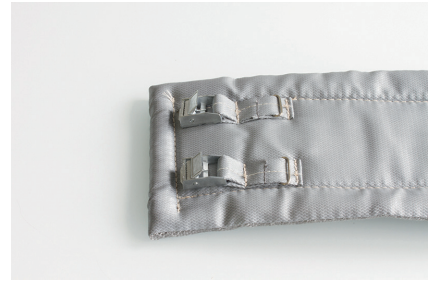
example 3 / Beispiel 3 fastener/belt locking system Spann/Gurtverschluss