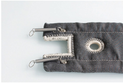
example 1 / Beispiel 1 spring/ring locking system Feder/Ringverschluss