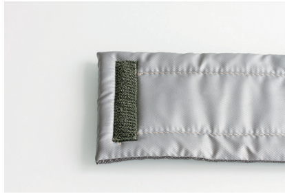
example 2 / Beispiel 2 Velcro/fleece locking system Klett/Flauschverschluss