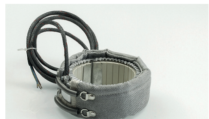
standard designs Standardausführungen